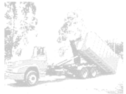
ROLO-ON/ROLO-OFF : CACAMBAS TIPO CONTAINER