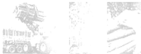
GUINDASTE E GARRA FLORESTAL