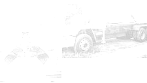
GUINDASTE E GARRA SUCALADA