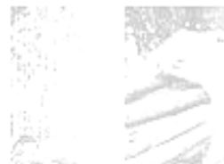
GUINDASTE E GARRA FLORESTAL