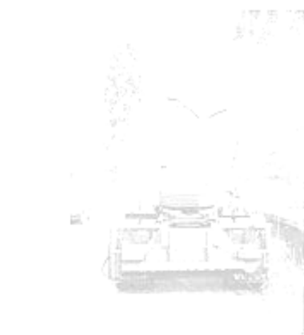
GUINDASTE HIDRÁULICO VEICULAR