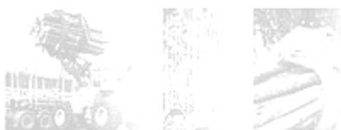
GUINDASTE E GARRA FLORESTAL