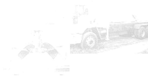
GUINDASTE E GARRA SUGA-CANHA