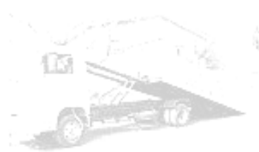
ROLI-ON/ROLI-OFF E CAÇAMBAS TIPO CONTAINER